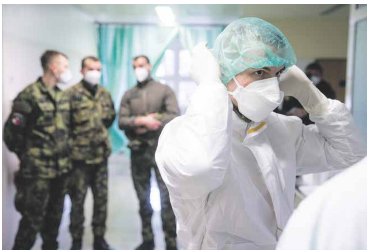
Pomoc armády v krajských nemocnicích se prodloužila.

Armádní složky vypomáhají jako sanitáři na covidových