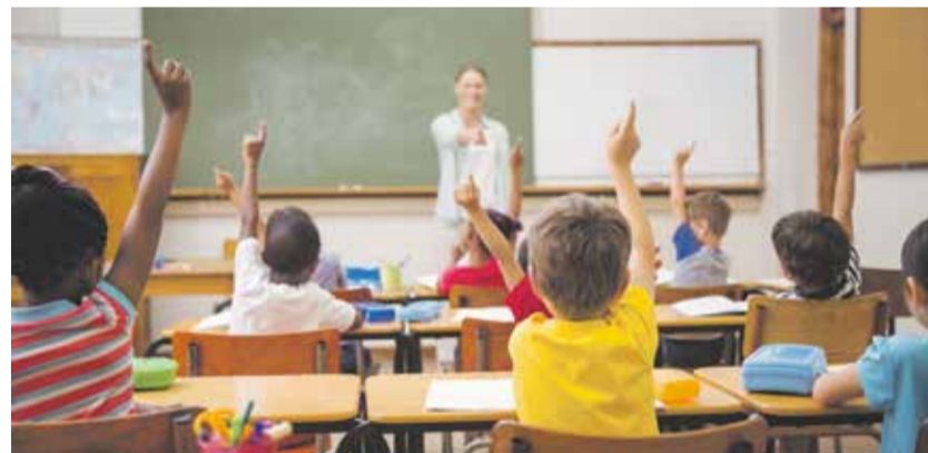
Největší část rozpočtu slouží pro financování mezd ve školství. ILUSTRACI FOTU

Na třetím místě co do objemu výdajů jsou evropské projekty, které spotřebují 1,6 miliardy korun.