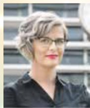
Hana Hajnová (PIRÁTI) náměstkyně hejtmána Kraje Vysočina

Přál bych nám všem, abychom byli víc soudržní. Aby měli manželé a životní partneři oporu jeden v druhém, aby se mohli opírat rodiče o své děti a děti o své rodiče. Aby rodiny držely pohromadě. Aby se udržela přátelství a nepolevila láska k bližním.