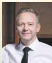
Vítězslav Schrek (ODS+STO) hejtmán Kraje Vysočina

Přál bych nám všem, abychom byli víc soudržní. Aby měli manželé a životní partneři oporu jeden v druhém, aby se mohli opírat rodiče o své děti a děti o své rodiče. Aby rodiny držely pohromadě. Aby se udržela přátelství a nepolevila láska k bližním.