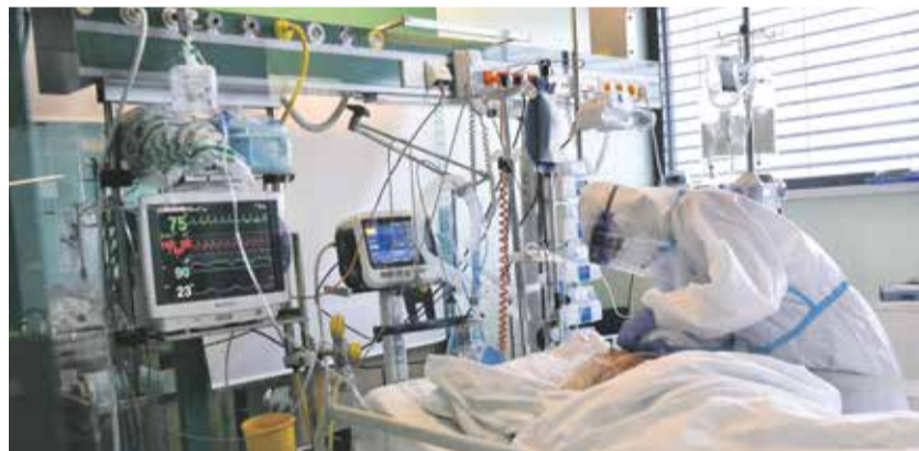
Covidové oddělení Nemocnice Jihlava.

Kraj Vysočina společně se spolupracujícími organizacemi Podané ruce naplánovaly mobilní očkování v konkrétních městech až do 21. prosince 2021. Další mobilní očkování bez nutné registrace bude pokračovat od 3. ledna 2022.