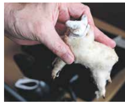
Dobová ovečka vyrobená z hlíny obalená cupovanou vlnou.

K dalším zvykům, které se pojí k adventnímu a vánočnímu času, patří zpívání. Za dřívějších dob chodili lidé na velmi brzké ranní mše svaté zvané roráty, které se mnohdy konaly jen při matném světle svíček. Až do vánočních