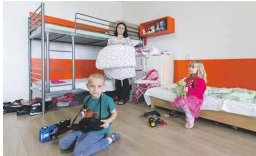
Součástí azylového domu je také herna pro děti, společenská místnost, studovna, kaple, cvičná kuchyně a návštěvní místnost.

lé sociálních služeb, které nezřizuje kraj, jsou zařazeni do speciálních programů podpory, které jsou hrazeny z Ministerstva práce a sociálních věcí. Tento program však skončil měsíc před koncem roku, proto se trebičský azylový dům dostal do provozních problémů. „Nemůžeme dopustit, aby byla tato