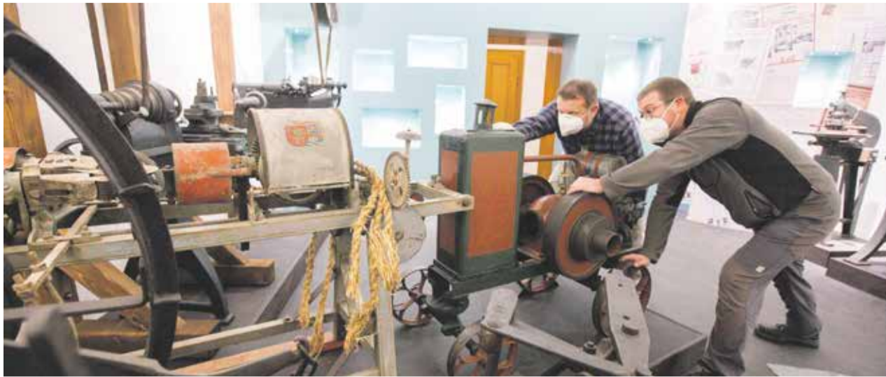
Muzejníci mají plné ruce práce s přípravou nových expozic. Návštěvníkům otevřou v dubnu příštího roku.

Čilý ruch nyní panuje v muzeu v Moravských Budějovicích. Dokončují se přípravy dvou nových expozic – řemesel a živností na jihozápadní Moravě a Příběh města a zámku. První návštěvníci je spatří v dubnu příštího roku. „Pro někoho může být výzva uplést pletýnku nebo si zkusit rozbít vepřecí či hovězí na jednotlivé části. Expozici jsme připravili tak, aby si návštěvníci mohli vyzkoušet některé činnosti spojené s řemesly,“