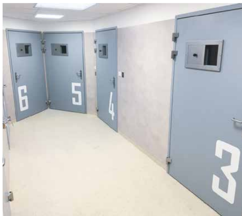
Na protialkoholní záchytné stanici je devět pokojů s celkovou kapacitou jedenácti osob.

Noc zde vyjde na čtyři tisíce korun a svůj dluh zaplatí jen třetina zachycených. Protialkoholní záchytná stanice v jihlavské nemocnici je spádovým místem pro Kraj Vysočina, má devět pokojů s celkovou kapacitou jedenácti