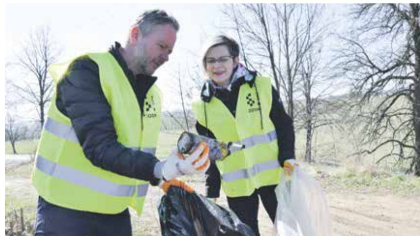
Rukavice si obleče i hejtman Vítězslav Schrek a náměstkyně Hana Hajnová.

Sběr odpadků proběhne od 10. do 23. dubna především v okolí silnic a na veřejných prostranstvích v obcích a městech na Vysočině. „Vysočina je typická svou krásnou přírodou, kterou nám mnozí závidí, pojďme proto přispět ke zkrášlení prostředí, ve kterém