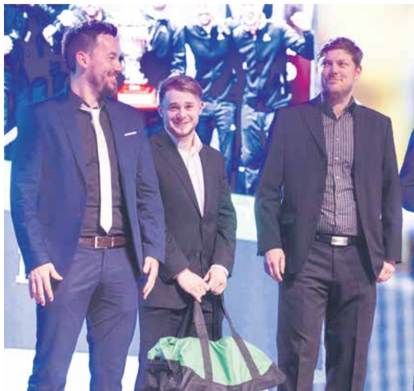
Momentka z vyhlášení Sportovce Kraje Vysočina za rok 2021. Slavnostní galavečer se loni konal v Třebíči.

V odborné části ankety bude o vítězích rozhodovat komise složená