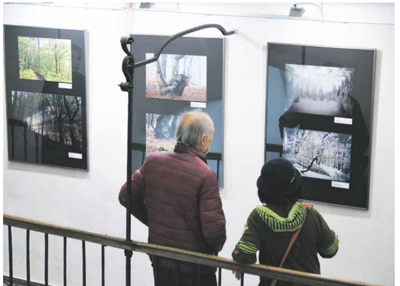
Jedna z posledních výstav v Muzeu Vysočiny v Jihlavě před uzavřením byla Photographia Natura. Ukazovala snímky amatérských fotografů.

Od začátku letošního roku jsou brány Muzea Vysočiny v Jihlavě pro veřejnost uzavřené. Důvodem jsou práce v interiérech muzea a modernizace expozic.