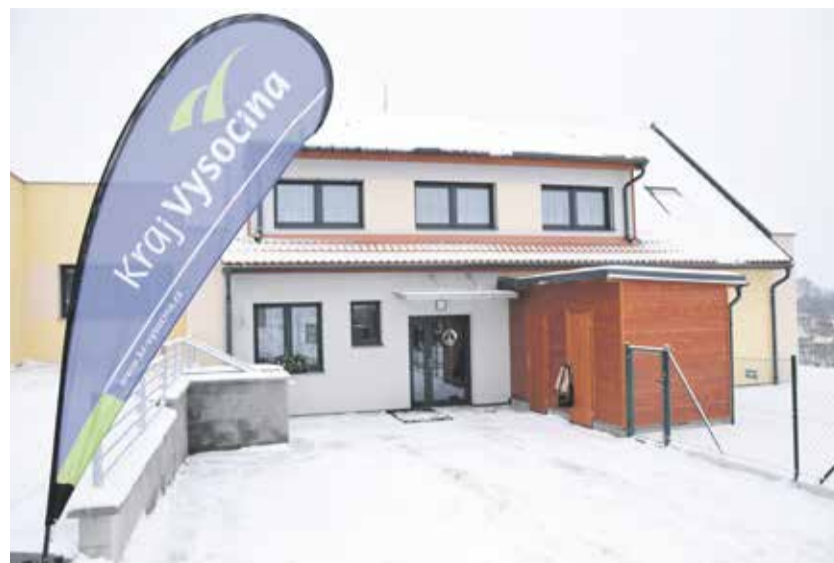
Ve Věži vyrostl nový domek, ve kterém se od ledna zabydleli klienti místního domova.

„Dvanáct klientů s nízkou mírou podpory se o sebe učí starat, a to včetně vaření, úklidu, praní prádla a dalších činností, které souvisí s životem v běžné domácnosti. Je to velká výzva pro klienty i personál. Pokud se podaří start, je to velká šance zvládnout návrat do normálního života bez nutnosti sociálního či zdravotního zařízení v zádech,“ uvedl radní pro oblast sociálních věcí Kraje Vysočina Jan Tourek (KDU-ČSL). V počátcích novým obyvatelům komunitních