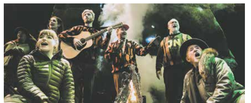
Nad Sázavou je muzikál s příběhy trampů.

Kraj Vysočina se rozhodl k této příležitosti nadělit malý dárek v podobě investičního příspěvku na nový autobus. „Horácké divadlo má tři autobusy různého stáří. Ten nejstarší už má 19 let a je potřeba ho obměnit. Kraj Vysočina přispěje částkou 4,5 milionu korun, divadlo přidá další půlmilion na nákup nového,“ uvedla náměstkyně hejtmána Kraje Vysočina Hana Hajnová (Piráti). Na autobus bude vypsána