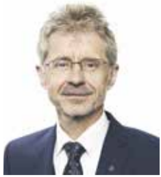
Miloš Vystrčil (ODS+STO) předseda Senátu a zastupitel Kraje Vysočina