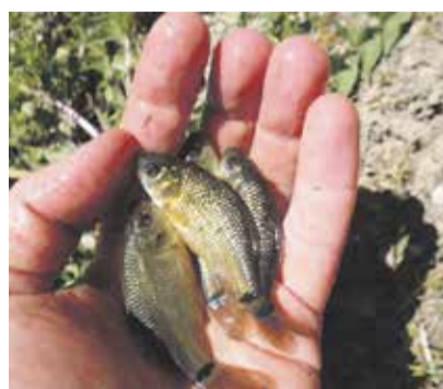
Ohrožený karas na Vysočině.

Karas patřil k nejběžnějším rybám, dnes je na pokraji vyhynutí. Proto se Kraj Vysočina zapojil s Akademií věd ČR, Českou zemědělskou univerzitou a pražskou ZOO do jeho záchrany. Odborníci vytypovali na Vysočině celkem dvacet lokalit pro další průzkum. „Pracovníci krajského úřadu se aktivně zapojili do potlačování nepůvodního karase stříbřitého na lesních rybníčkách Moravskobudějovicka a do přenosu karase obecného do