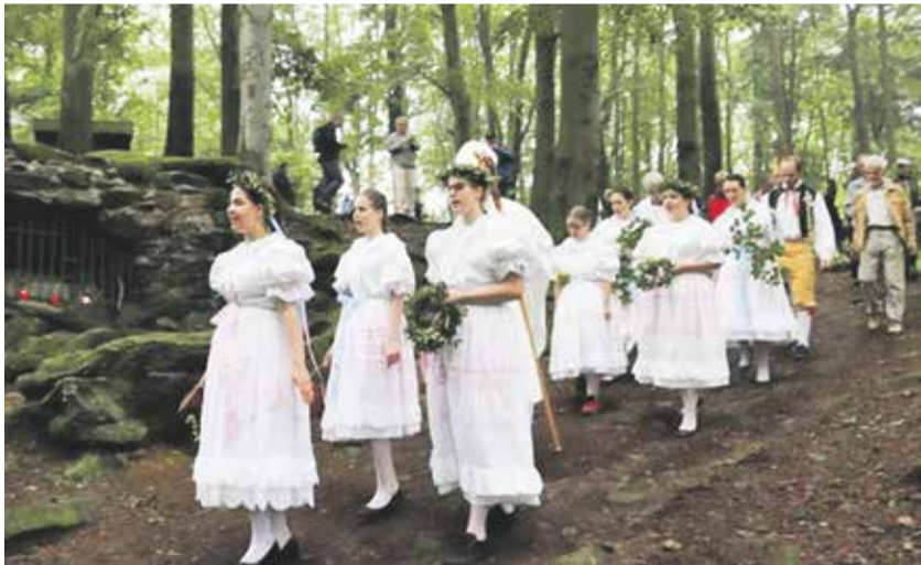
Křemešnická pouť patří k největším na Vysočině.

Křemešnická pouť je dalším regionálním jevem, který rozšířil Seznam nemateriálních statků tradiční lidové kultury Kraje Vysočina.