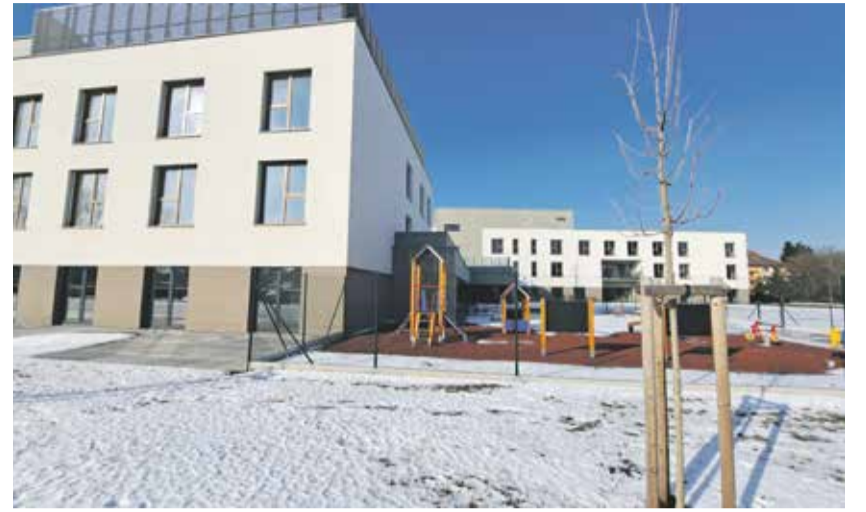
Sociální centrum Kraje Vysočina poskytne zázemí i dětem z mateřské školy.

O provoz školky se postará Mateřská škola a Speciálně pedagogické centrum Jihlava. „Prostory vybavíme nábytkem a vším, co bude třeba, po dohodě s provozovatelem. Školka bude na prostoru větším než 200 metrů čtverečních, počítáme i s potřebnou úpravou venkovních ploch tak, aby vyhovovaly potřebám školky,“ popsal radní