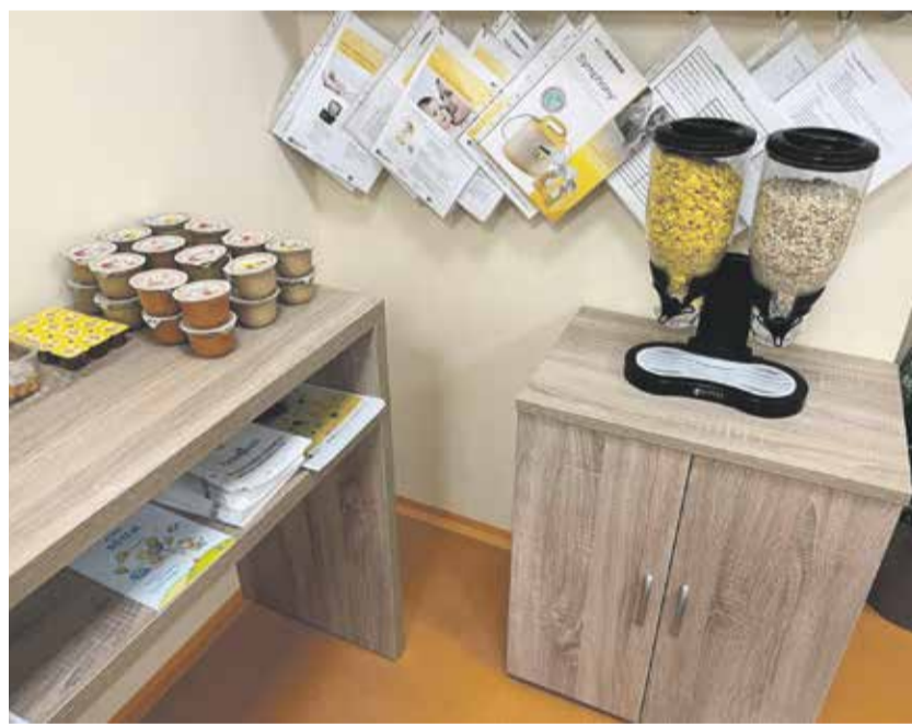
Celodenní bufetové stravování pro novopečené maminky v porodnicích.

Pacientky s dietními omezeními dostávají stravu individuálně na základě indikované diety a nebo jim s výběrem pomůže nutriční terapeutka. „Ze stravovacího provozu denně chodí pouze pečivo, obědy a večere. S večeri posíláme