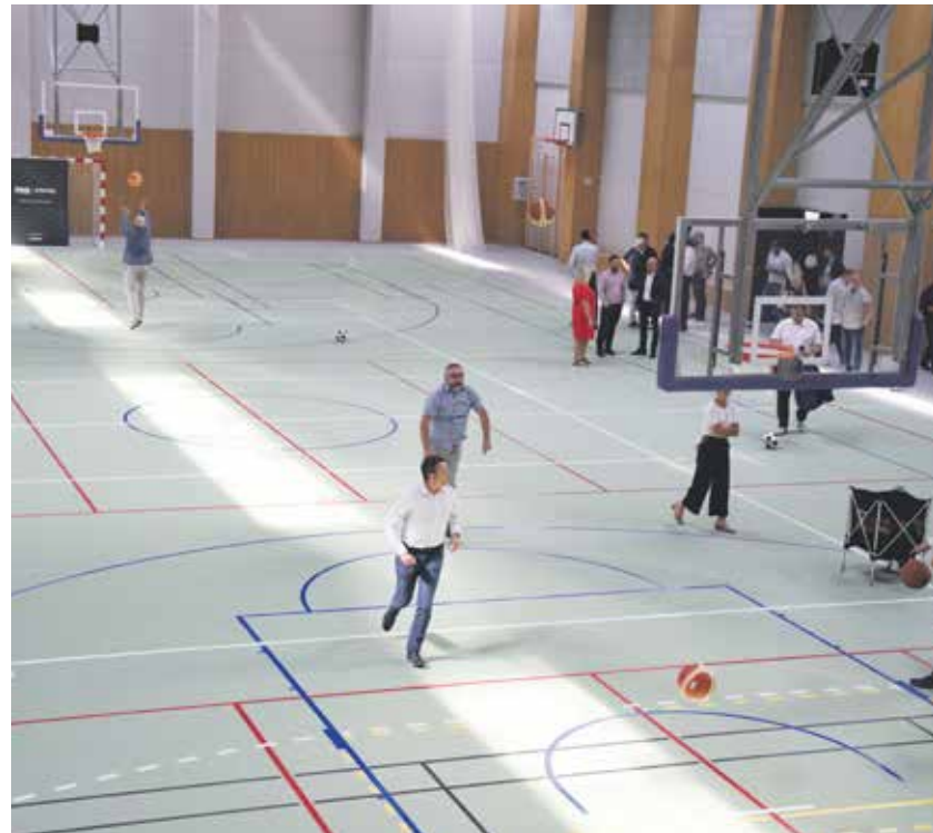
Nově otevřená sportovní hala ve Žďáře nad Sázavou má dokonce horolezeckou stěnu.

Nová hala ve Žďáře nad Sázavou Sportovní hala ve Žďáře nad Sázavou, která je přístupná od nového školního roku, je vybavena pro řadu sportů včetně florbalu, basketbalu a tenisu. Součástí je i lezecká stěna a posilovna. „Hala bude k dispozici pro pravidelnou výuku tělesné výchovy především VOŠ a SPŠ Žďár nad Sázavou a krajskému gymnáziu. Využití poskytnou i místní střední a vyšší odborné zdravotnické školy. V odpoledních hodinách bude sportovní hala dostupná místním sportovním organizacím i širší veřejnosti,“ sdělil Jan Břížďala. Tělocvična přišla kraj na více než 143 milionů korun