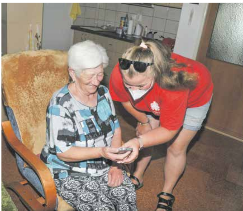
Charitní práce v terénu u klientů.