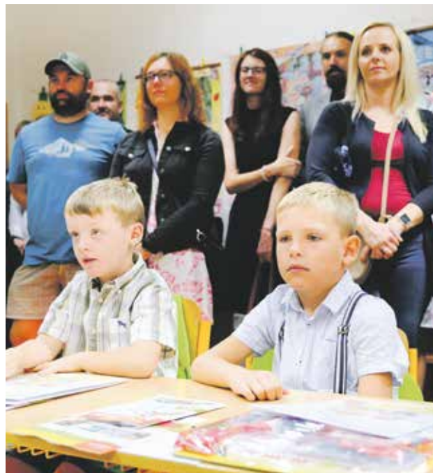
První školní den vyrazil hejtman Kraje Vysočina Vítězslav Schrek za prvňáky ve Velké Bíteši.

Svůj velký den prožívalo na Vysočině v pondělí 4. září přes pět a půl tisíce prvňáčků. Ti se vůbec poprvé posadili do školní lavice. Od Kraje Vysočina dostali reflexní batůžek s celou řadou užitečných