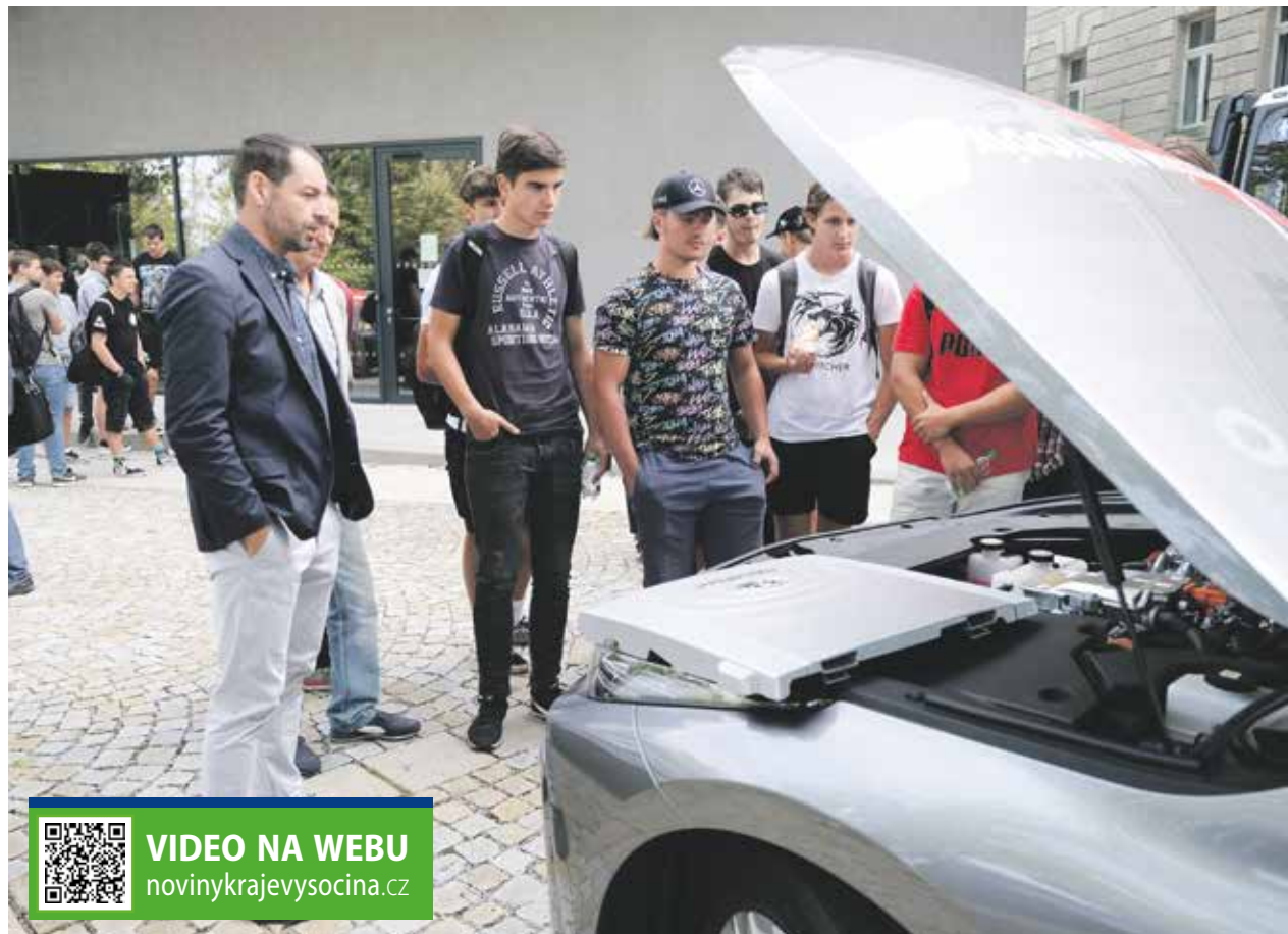
Studenti středních škol v Jihlavě se seznamovali s vodíkovou budoucností v automobilovém průmyslu.

Automobilový průmysl se jeví jako nejperspektivnější odvětví, ve