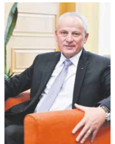
Miroslav Houška (KDU-ČSL) náměstek hejtmana Kraje Vysočina pro oblast ekonomiky, dopravy a silničního hospodářství

V současné době připravujeme krajský rozpočet na rok 2024. Tedy návod k tomu, co dělat nejenom v roce příštím, ale připravovat i pro léta následná. Ve dvou předchozích rozpočtech na roky 2021 a 2022 jsme museli některé představy velice mírnit. Ať už to bylo kvůli pandemii Covidu nebo zvýšené míře inflace, která velice zneprjemnila a také zbrzdila některé naše investice. Teď se realisticky díváme na možnosti, které má Kraj Vysočina před sebou.