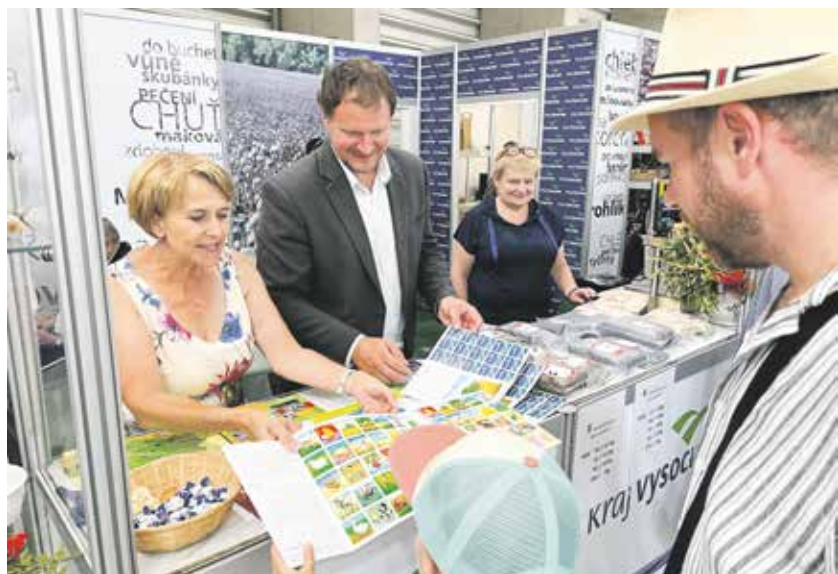
Stánek Kraje Vysočina na Zemi živitelce v Českých Budějovicích byl neustále v obležení návštěvníků.

Ani letos nechyběl stánek Kraje Vysočina na výstavě Země živitelka v Českých Budějovicích. Jde o největší a nejvýznamnější akci v České republice, na které se prezentuje zemědělská technika, rostlinná i živočišná výroba a spousta dobrého jídla a kvalitní regionální potraviny. Akce se konala koncem srpna. Kraj Vysočina se zúčastnil už po patnácté.