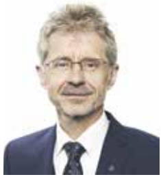
Miloš Vystrčil (ODS+STO) předseda Senátu a zastupitel Kraje Vysočina

Wysočinské památky UNESCO zaujaly Taiwan Zelená hora ve Žďáře nad Sázavou, bazilika svatého Prokopa a židovská čtvrť se synagogou a hřbitovem v Třebíči, historické jádro Telče a Zámek Telč jsou památky UNESCO ve třech městech Vysočiny. Žádný jiný kraj tolik historických památek zapsaných na seznam světového dědictví UNESCO nemá. Nebylo proto příliš těžké přesvědčit delegaci ministerstva kultury Taiwanu, aby v rámci své návštěvy byly právě o těchto