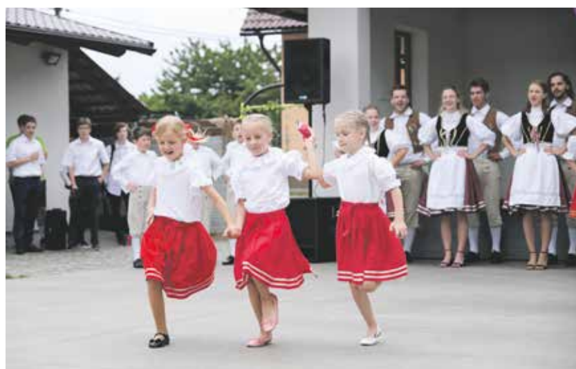
Bohatý spolkový a komunitní život. I za to dostala obec Cenu veřejnosti.

A vítězství to bylo doslova o parník. Nová Ves u Nového Města na