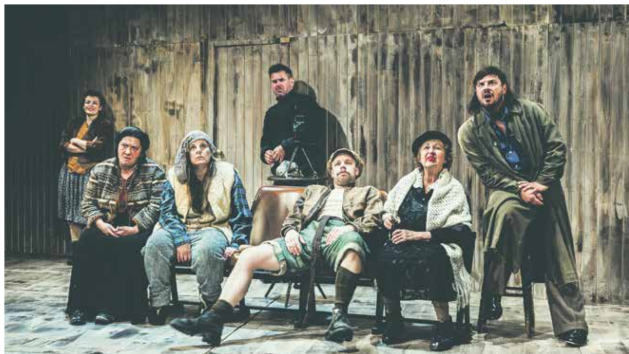
První premiérou nové divadelní sezóny byla černá komedie Mrzák inishmaanský. Návštěvníci se prošli po červeném kobereci.