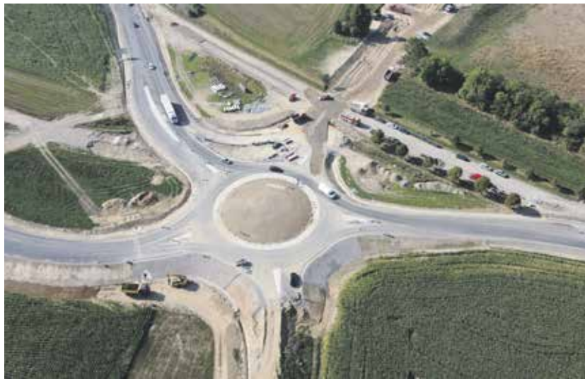
Pohled na vznik nové okružní křižovatky na jižní části jihovýchodního obchvatu Jihlavy.

Do celkových čísel je zahrnuto dodatečných pětadvacet oprav krajských silnic za tři sta