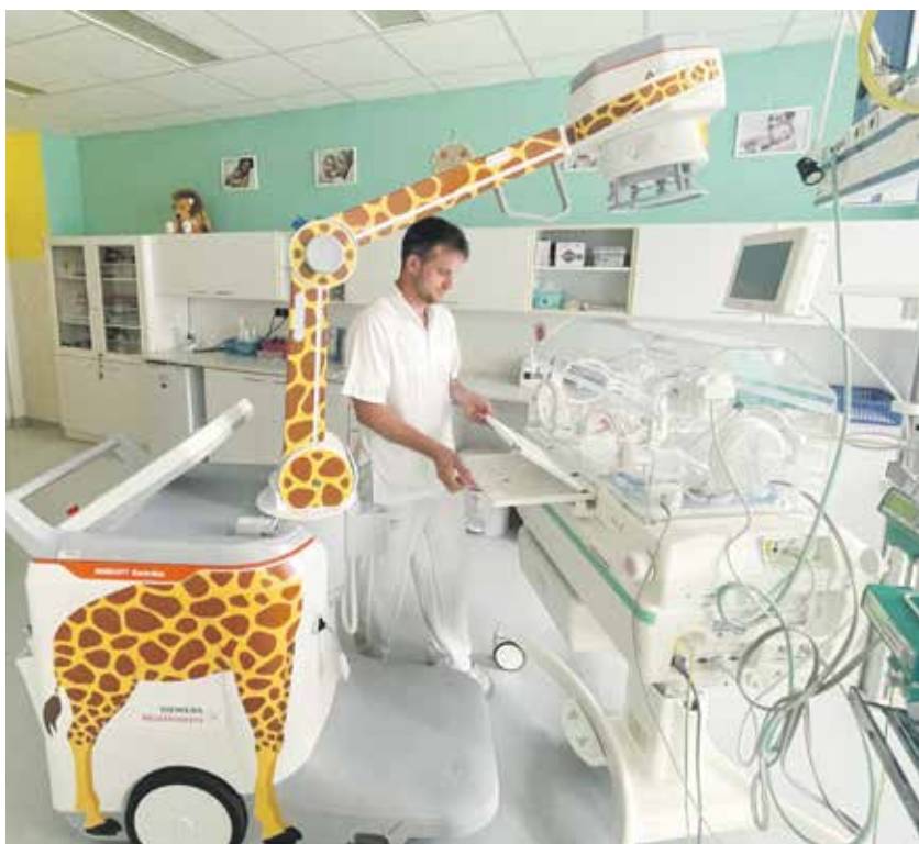
Nový pojízdný rentgen na dětském oddělení má na sobě obrázek žirafy.

Stojí miliony korun, ale zachraňují životy. Řeč je o nových přístrojích v krajských nemocnicích. Nové pojízdné rentgeny usnadňují práci zdravotníkům v Nemocnici Jihlava. V Havlíčkově Brodě zase pořídili vysoce moderní přístroj CT – počítačový tomograf. Ten nabízí kvalitnější zobrazení a rychlejší vyšetření. Pacientům přináší i nižší dávku ozáření.