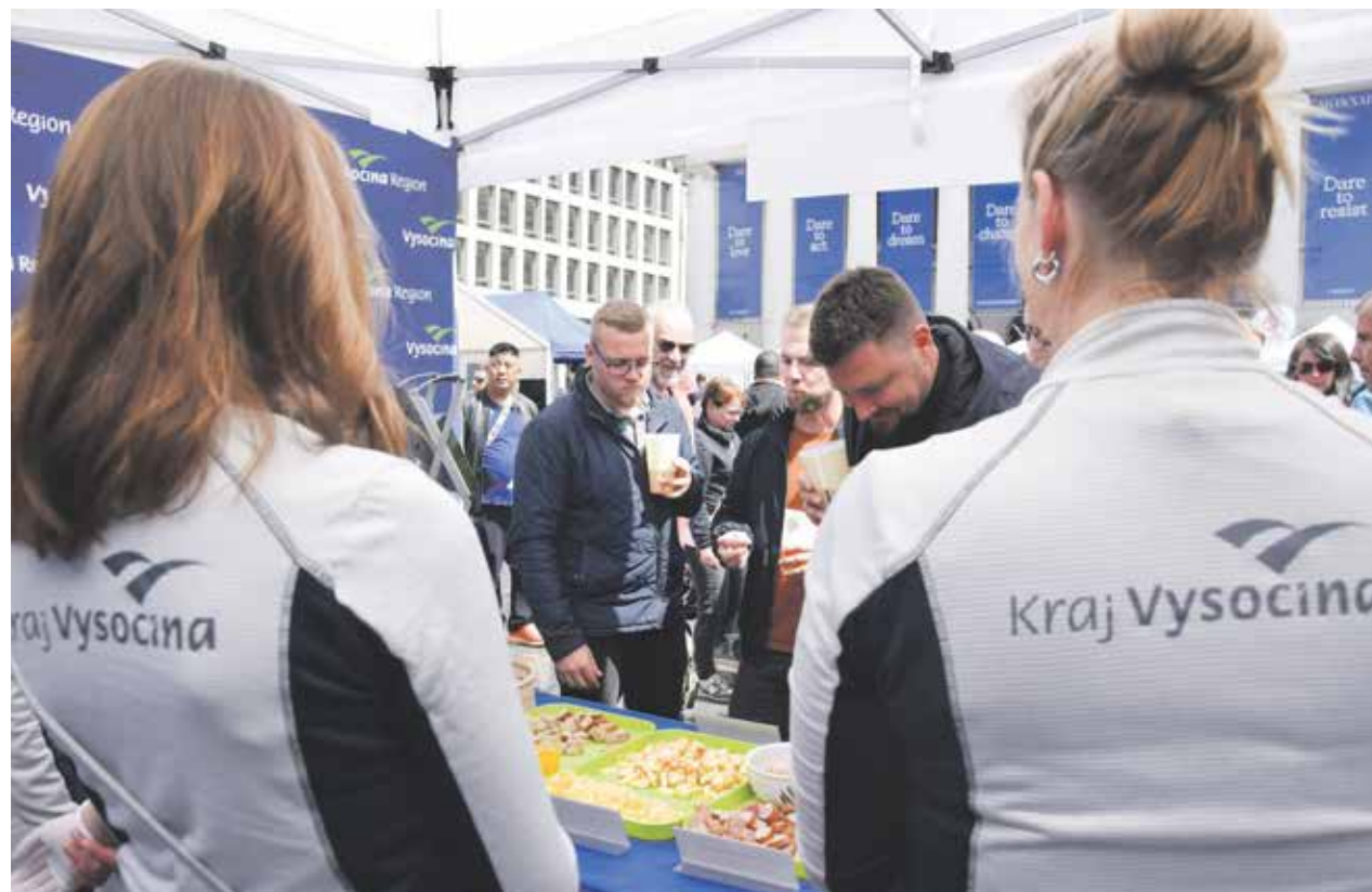
Krajský stánek v Bruselu nabídl regionální produkty a prostor pro setkání a diskuzi.

O prvním červnovém víkendu se Kraj Vysočina představil na prestižním festivalu Czech Street Party, který se konal v belgickém Bruselu. Páteční odpoledne na Place de la Monnaie patřilo České republice, její bohaté kultuře, gastronomii a jednotlivým regionům. Letošní ročník byl obzvláště výjimečný díky oslavě dvaceti let členství České republiky v Evropské unii. Vysočina na svém stánku nabídla návštěvníkům regionální pochoutky – masné produkty ze Školního statku