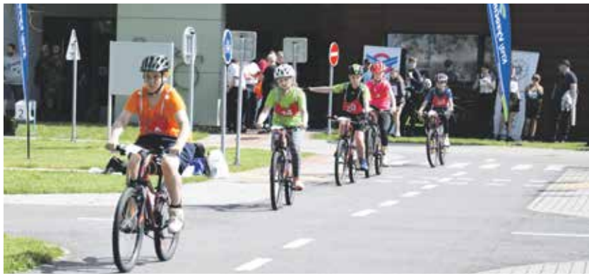
Krajské finále se konalo na dopravním hřišti v Jihlavě.

Dopravní hřiště v Jihlavě bylo svědkem krajského finále Dopravní soutěže mladých cyklistů. Vítězové oblastních závodů se mezi sebou utkali v pěti různých disciplínách. Mezi nimi byla například jízda zručnosti, test z pravidel silničního provozu nebo první pomoc.