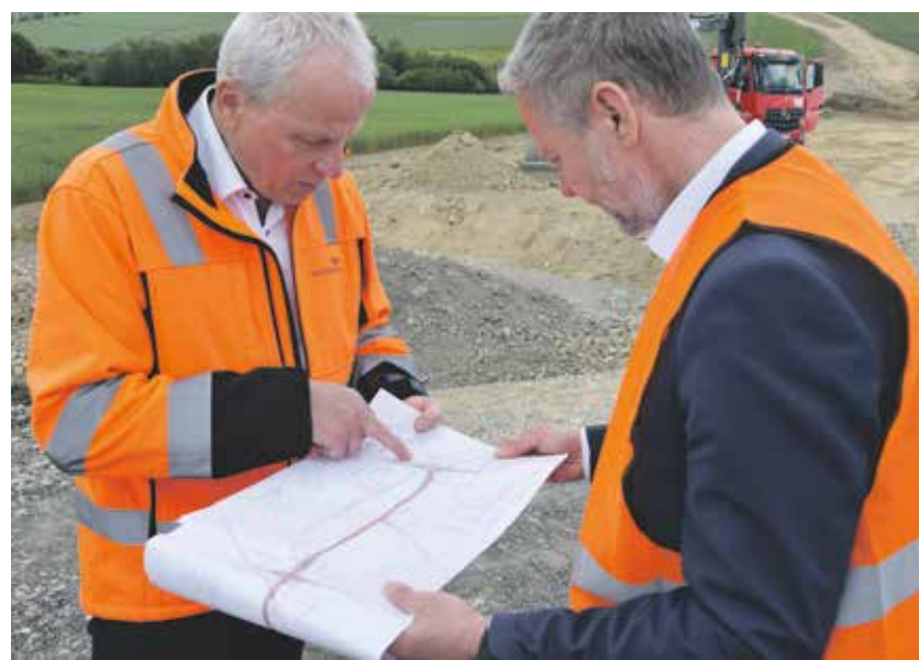
Na začátek stavby druhé části obchvatu se přijeli podívat také náměstek hejtmana Kraje Vysočina Miroslav Houška a hejtman Kraje Vysočina Vítězslav Schrek.

Východní část obchvatu vyjde na 277 milionů korun bez DPH a stavbu plně pokryje dotace ze Státního fondu dopravní