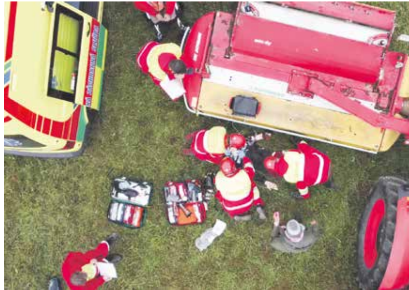
Zdravotnická záchranná služba v Kraji Vysočina má za sebou za posledních dvacet let přes tři čtvrtě milionu výjezdů.

Průměrný počet výjezdů se za posledních deset let pohybuje kolem 45 tisíc za rok. Počty ale