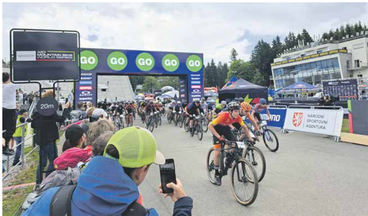
Lidé si užili nabitý víkend se závody horských kol ve Vysočina Areně. Kromě závodů je čekal bohatý doprovodný program.

Vysočina Arena v Novém Městě na Moravě hostila v závěru května závody světového poháru horských kol UCI Mountain Bike Worlds Series. Na šampionátu s českou účastí nechyběl ani promotým Kraje Vysočina se stánkem plným zábavy. Víkend byl nabitý nejen sportovními zážitky, diváci mohli nahlédnout i do zákulisí. „Atmosféra závodů byla úžasná, lidé měli