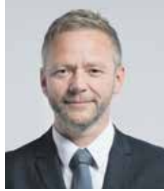
Vítězslav Schrek (ODS+STO) hejtmán Kraje Vysočina

stravovacího provozu jihlavské nemocnice nebo nové operační sály v trebičské nemocnici. Vybudovaly se obchvaty Nového Veselí a Velkého Beranova a mnoho dalšího. Někdy jsem pracovní nasazení přeháněl, ale to je podle mého dobře. Prioritou pro nás bylo, je a bude zdraví lidí z Vysočiny. Zdravotnictví musí být dostupné a kvalitní. Dostupná je třeba také terénní pečovatelská služba a stejně významné jsou domovy nebo byty s pečovatelskou službou. Musí se přestat lepit silnice, silnice, je třeba začít je kvalitně opravovat. Pro náš region je důležitá dostavba Jaderné elektrárny Dukovany. Měli bychom přijímat nové a moderní technologie, ale ne na úkor přírody. Dalšími našimi prioritami je kvalitní školství a možnosti kulturního a společenského vyžití. Je potřeba používat zdravý selský rozum, a ne se jen řídit tím, na co jsou státní dotace. Dnes máme zkušený tým nadšených profesionálů a jsem poctěn, že mohu být v čele kandidátky na nadcházející krajské volby. Pracujeme na 100 %, myslíme na lidi z Vysočiny a chystáme se na nadcházející volby. Buďte u toho s námi.