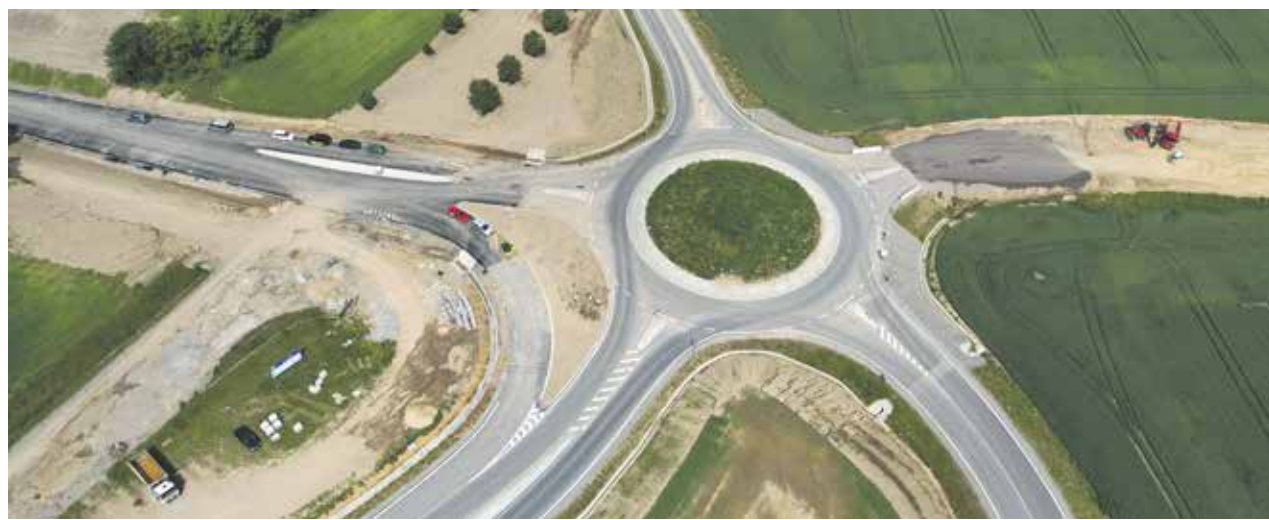
Okružní křižovatka na výpadek na Třebíč a její budoucí napojení na východní část obchvatu.