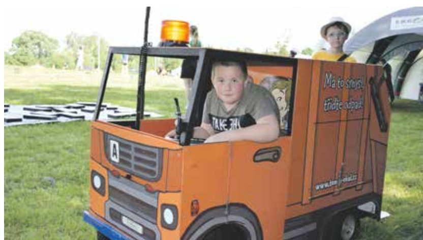
Děti si mohly vyzkoušet pestré aktivity u jednotlivých stanovišť. Některé vypadaly na první pohled nebezpečné, ale byly pod dozorem zkušených lektorů.