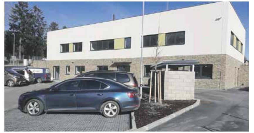
Hospic bude provozovat spolek Mezi stromy.