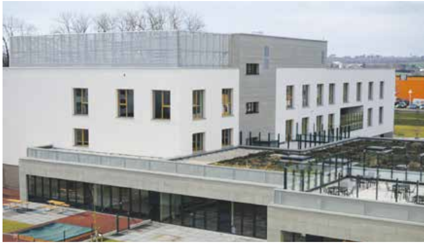
Sociální centrum Kraje Vysočina rozšiřuje ve svých prostorách služby i pro širokou veřejnost.