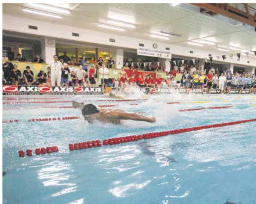
Krajskou dotaci dostane také Bazén E. Rošického v Jihlavě. Ta pokryje část nákladů na opravu bazénových van.

Dotací titul navazuje na podobný program Sportovní