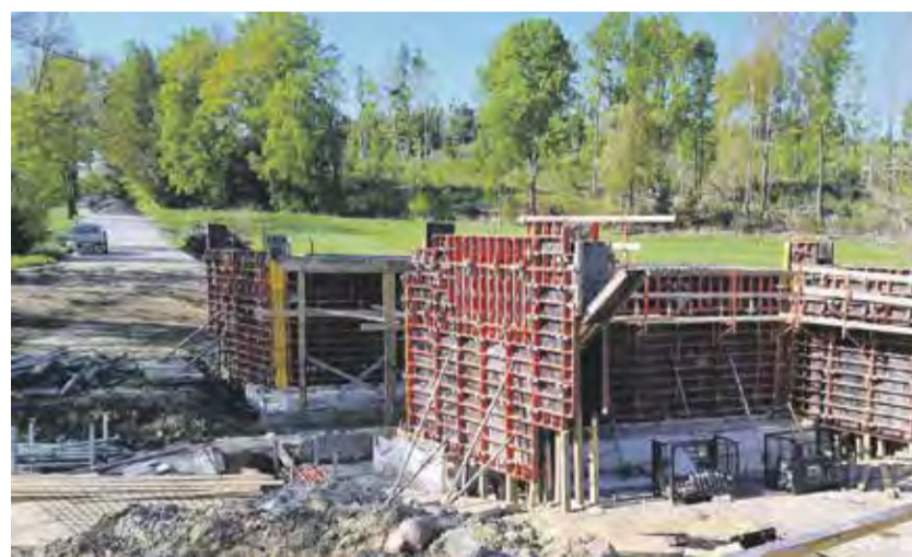
Krajsí silničáři intenzivně pracují na silnicích druhé a třetí třídy a také opravují mosty. Na fotografii most v Janovicích.

Na Třebíčsku se krajsí silničáři chystají na rekonstrukci mezi Červenou Hospodou a obcí Okříšky na silnici II/405. Jde o hlavní tah na Jihlavu. Práce budou za