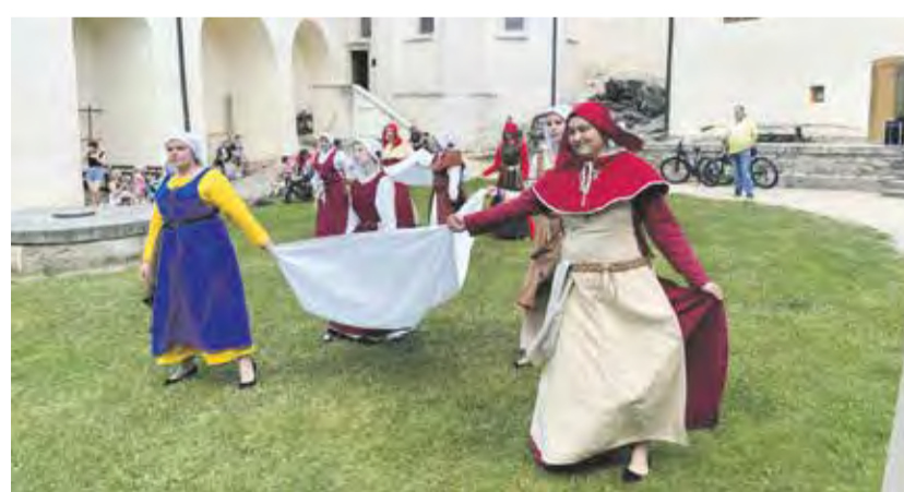
Divadelní prohlídky na hradě Roštejn jsou každoročním letním zpestřením sezony. Ročně si na ně najdou cestu stovky návštěvníků. Navíc můžete domů poslat z tohoto kouzelného místa prázdninový pohled.

A co dělat, když venku prší a počasí nepřeje? Zkuste vyrazit do třebíčského centra vědy Alternátor v areálu bývalé firmy BOPO