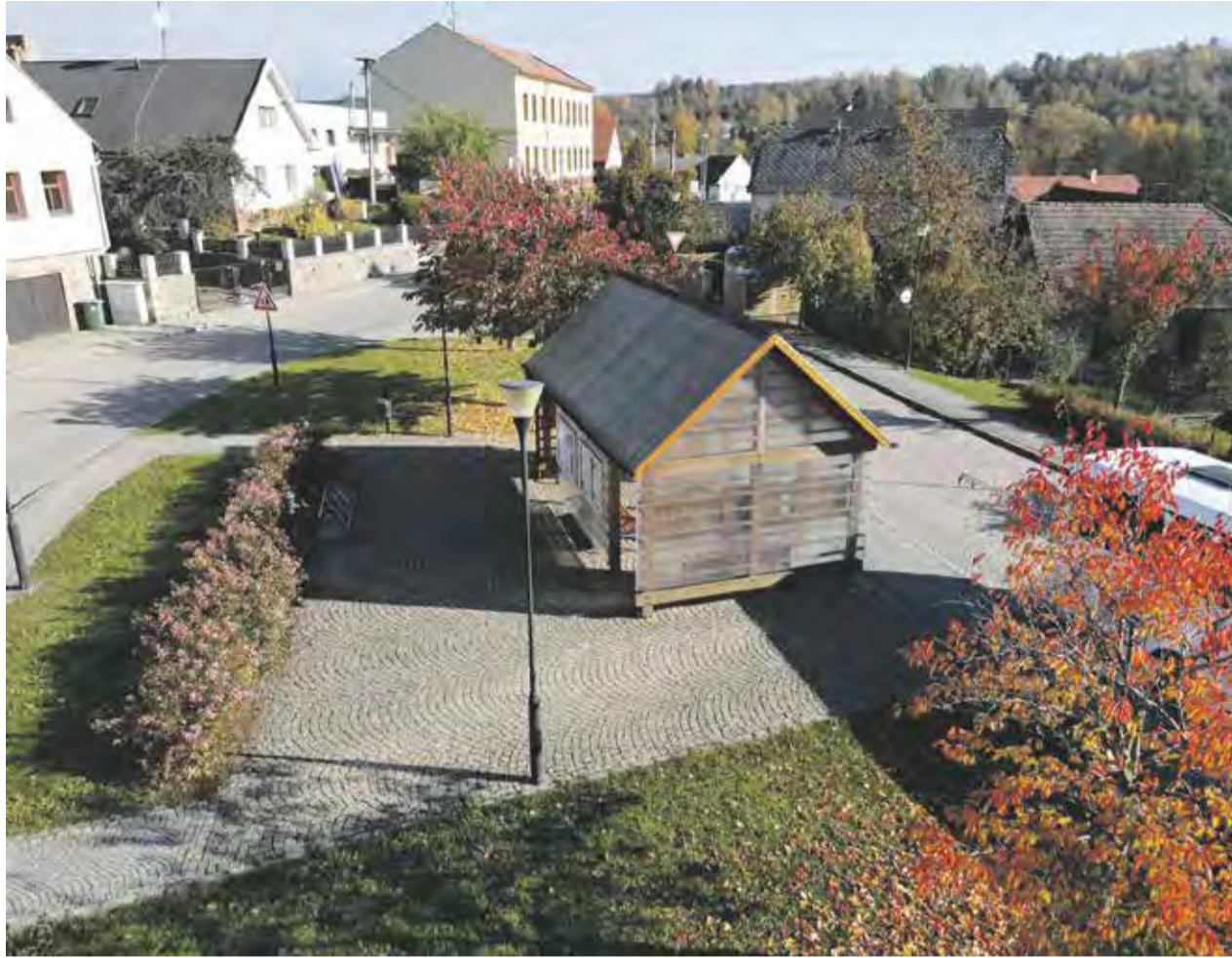
Centrum vítězné obce Dolní Město.

Vesnici roku Kraje Vysočina pro rok 2025 se stalo Dolní Město na Havlíčkovobrodsku s necelou tisícovkou obyvatel. Obec nebyla v soutěži žádným nováčkem, už v minulosti získala dílčí ocenění. Konkrétně Zelenou stuhu za péči o zeleň a životní prostředí a Cenu naděje pro živý venkov.