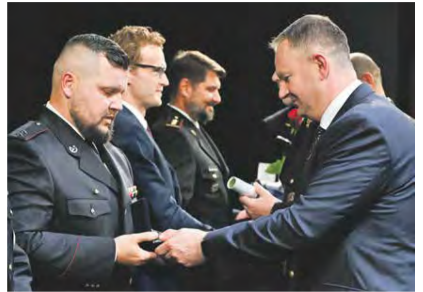
Momentka ze slavnostního udělování Záslužných medailí Kraje Vysočina na konci května.

Pětadvacet Záslužných medailí Kraje Vysočina už zná své majitele. Na konci května hejtman Kraje Vysočina Martin Kukla předal ocenění zástupcům složek Integrovaného záchranného systému Kraje Vysočina a také civilním osobám, které přispěly k záchraně lidských životů a zachovaly se statečně v mimořádné situaci.