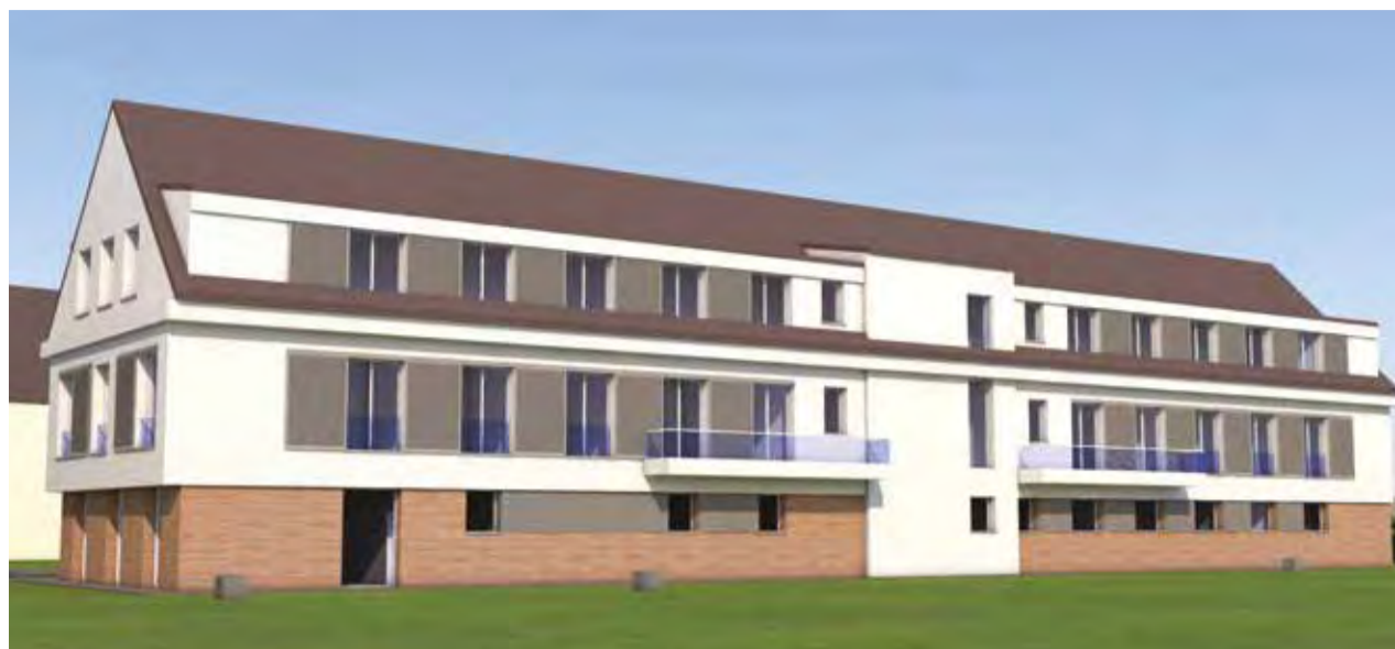
Vizualizace nového pavilonu v Nových Syrovicích.

Pobytové sociální služby na Vysočině čeká výrazné posílení. Aktuálně v kraji funguje 3 363 lůžek, což je téměř o sedm set více než před sedmi lety. Přesto poptávka dál roste. „Nyní evidujeme 3 724 osob, které mají zájem o umístění do pobytových sociálních služeb,“ informoval radní pro oblast sociálních věcí Jiří Horký (ANO 2011). Čekací lhůty nejsou