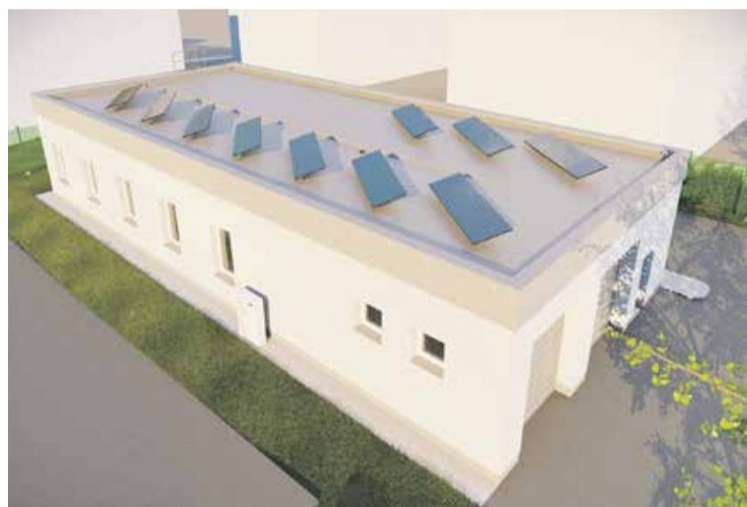
Vizualizace budoucí krajské výjezdové stanice v Pacově.

Modernizace výjezdových stanic pro záchranáře v Kraji Vysočina bude pokračovat i v příštím roce. Dočkat by se měli krajsí záchranáři v Pacově. Jednopodlažní budova bude vybavená obytnými prostory, denní místností, kuchyňkou, sociálním zázemím a v plánu jsou také dvě garáže pro zásahové vozy.