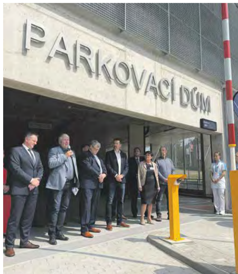
Problém s parkováním je vyřešený. Do nového parkovacího domu se vejde 216 aut.

Během slavnostního otevření 9. června připravila třebíčská nemocnice komentovanou