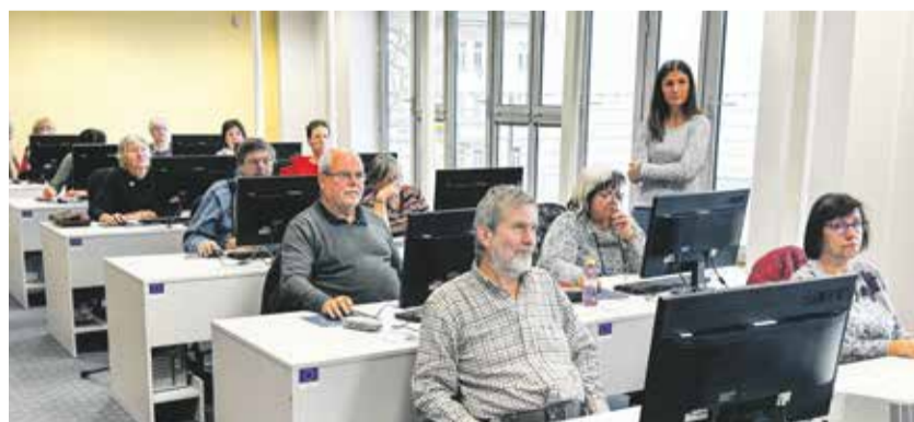
V Jihlavě byl o semináře, které seniory seznámily s prací s umělou inteligencí, velký zájem.

Účastníci se seznámili s AI asistentem od Googlu Gemini, naučili se správné postupy pro vyhledávání informací a lektor jim přiblížil pomoc se psaním textů až po zábavné využití pro volný čas. „Žádné předchozí zkušenosti s používáním umělé inteligence jsem neměla. Všechno pro mě bylo nové, ale moc hezky, jednoduše a srozumitelně