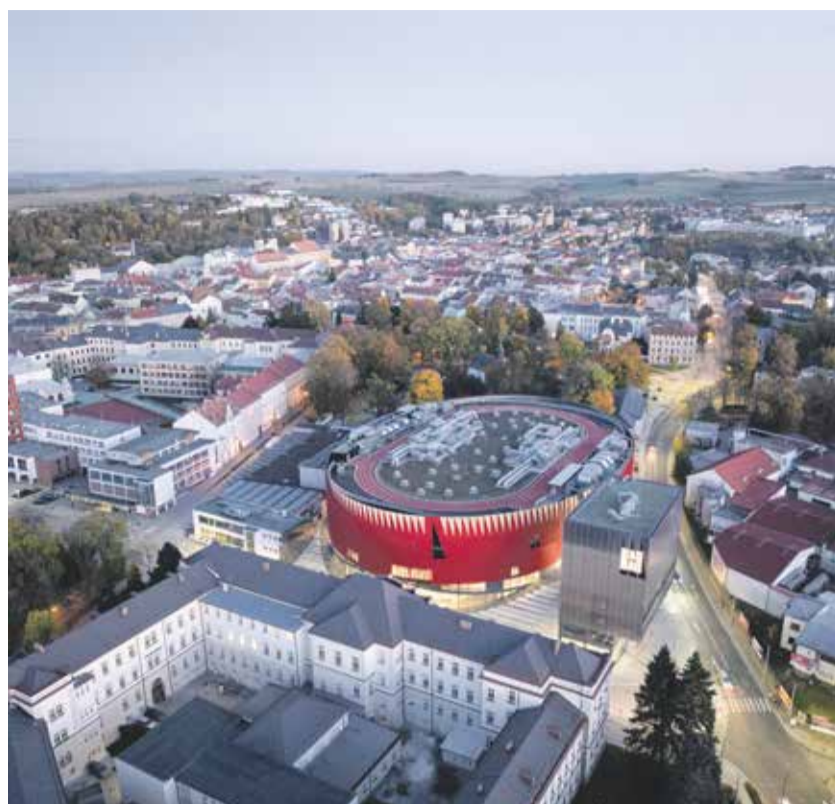
Moderní multifunkční stavba v centru Jihlavy se velice rychle stala místem s nadregionálním významem. Sjíždí se sem lidé z různých koutů Vysočiny.

Aréna stojí v místě bývalého zimního stadionu. Při hokejových zápasech má kapacitu 5 581 fanoušků, na kulturní akce vznikne prostor až pro 7 500 tisíce lidí. První velkou akcí bylo slavnostní otevření, které se konalo v sobotu 8. listopadu. Hlavním hudebním hostem byla česká slavnice Ewa Farna. Před Vánoceci hala ožije vánočním koncertem Michala Davida.