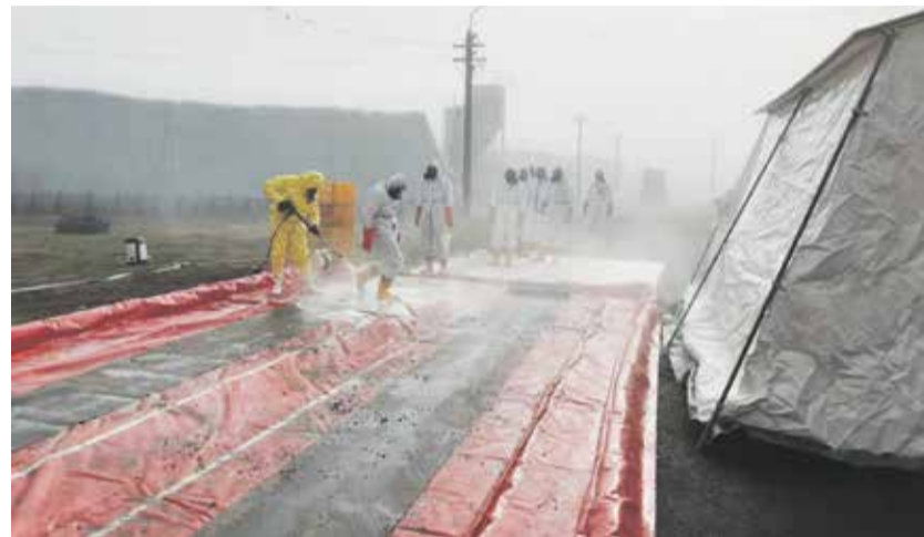
Ve Valdíkove na Třebíčsku se objevila ptačí chřipka. Veterináři s hasiči tu museli utratit na dvacet tisíc kachen.