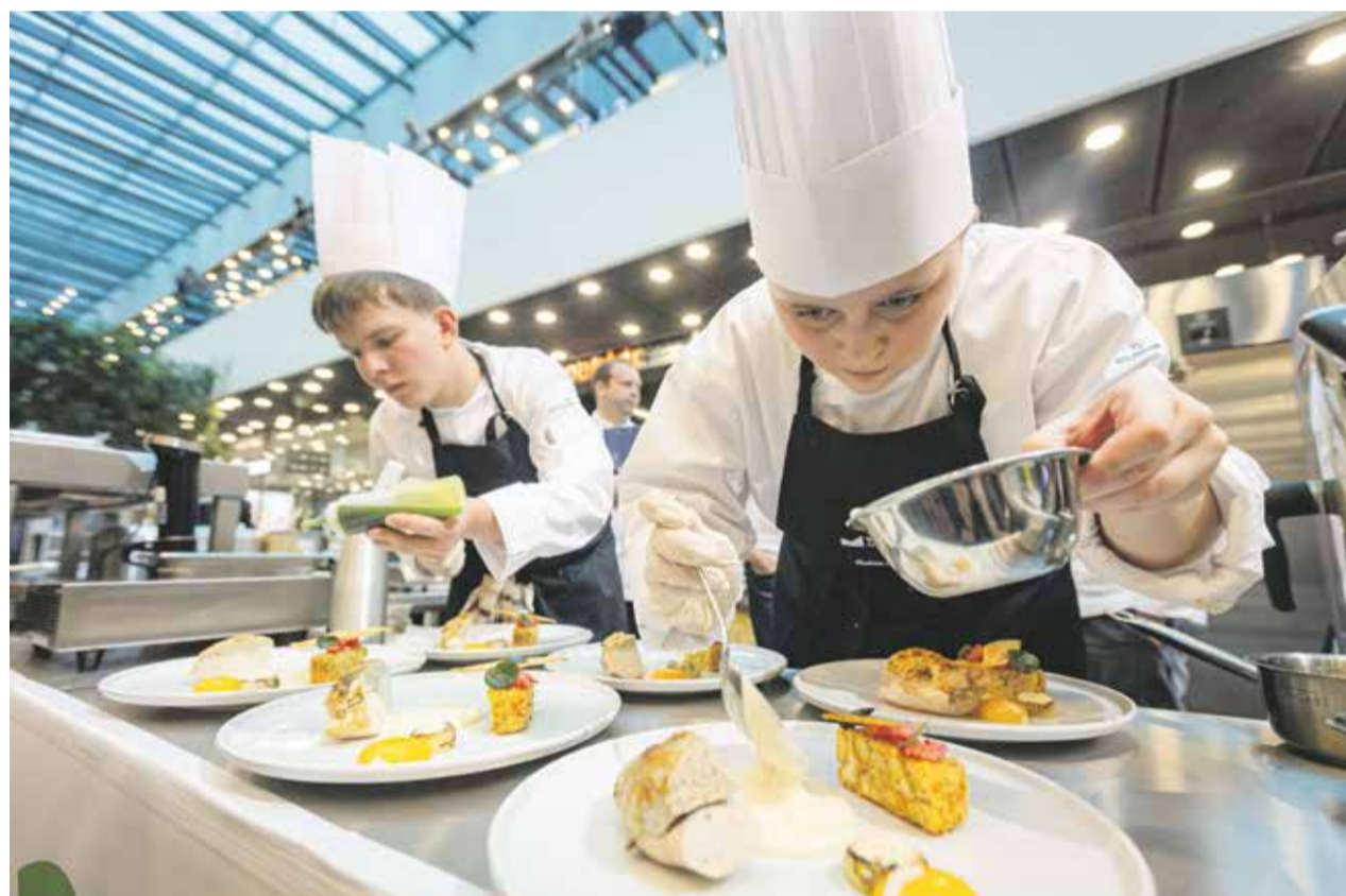
Do letošního ročníku mezinárodní soutěže Trophée Mille, který se konal první listopadovou sobotou v jihlavském Cityparku, se přihlásilo patnáct týmů z gastronomických škol z celé České republiky. Do finále postoupilo šest z nich, čtyři z Kraje Vysočina.