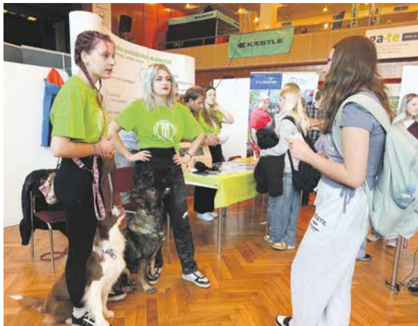
Studentky České zemědělské akademie v Humpolci představovaly budoucím zájemcům obor chovatelství-kynologie.

Podzimním měsícům vévodí přehlídky středních škol. Ty se konají napříč regionem. Největší se konala začátkem listopadu v Domě kultury ve Žďáře nad Sázavou. Festival vzdělávání navštívilo kolem 1 500 lidí.