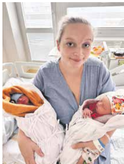
Šťastná maminka s dvojčátky, která měla ojedinělý start do života. Nemají stejné datum narození.

Od začátku roku do konce letošního října se v jihlavské porodnici