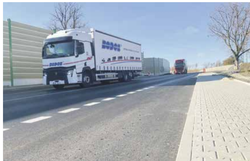
Obchvat Rytířska odvedl tranzitní dopravu z obce. Auta jezdí kolem nové protihlukové stěny.