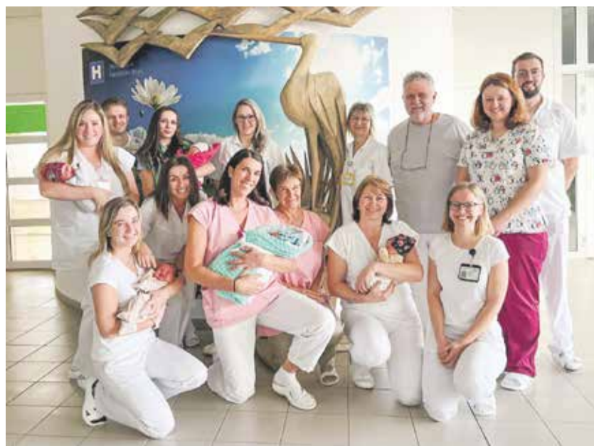
Porodnice v Havlíčkově Brodě má v letošním roce za sebou už více než osm set porodů.

Výraznou proměnu zaznamenala také strava pro rodičky. Klasickou nabídku doplnily svačinky mezi hlavními jídly, v jídelničce je také více zeleniny a lehkých pokrmů.